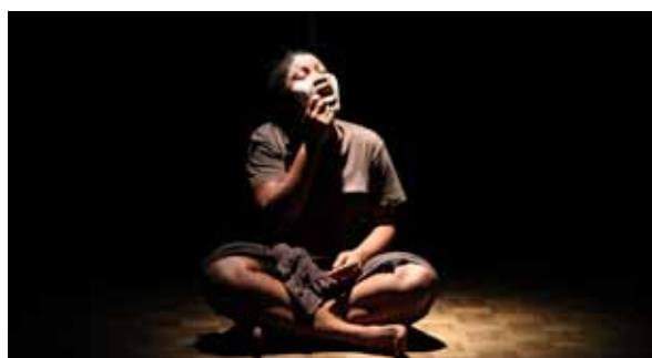
Les Larmes du ciel d'août