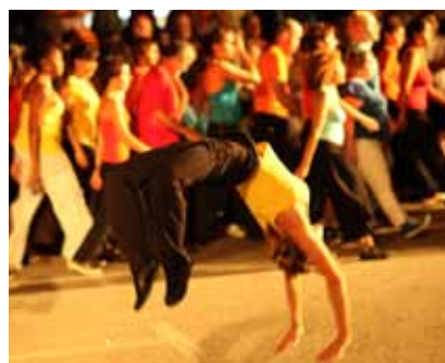
Souvenir de la rue Princesse (soir)