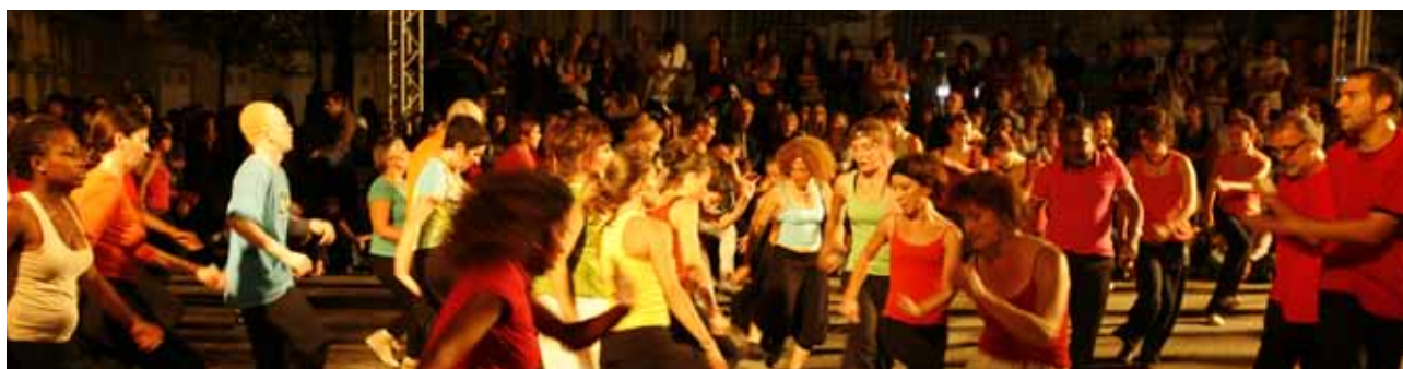
Souvenir de la Rue Princesse

Les propositions artistiques à entrée libre deviennent un pan non négligeable de l'activité globale du Festival sur les onze jours de sa réalisation.