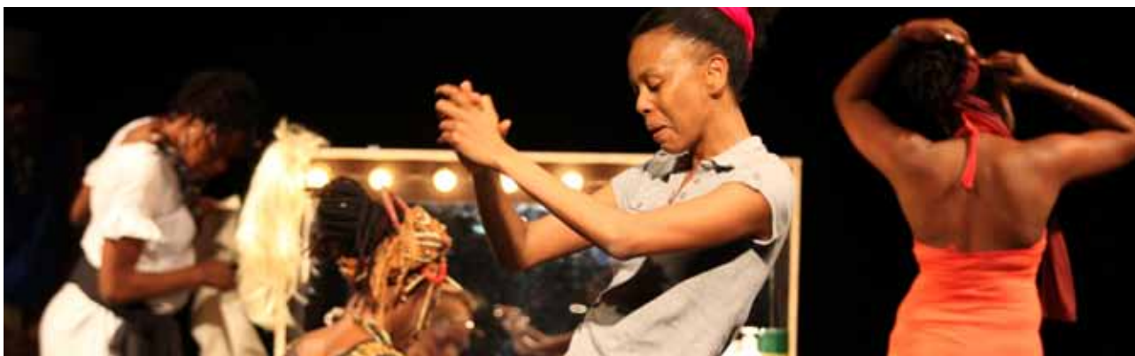
Moi et mon cheveu

Ces partenariats, qui restent néanmoins mineurs par rapport au budget global du festival, permettent de valoriser certaines actions, qui sans eux, n'auraient pas la même ampleur.