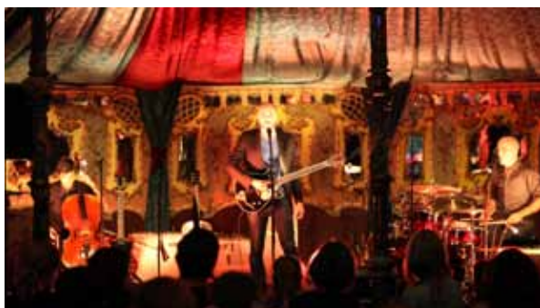
Concert Frédéric Nevchehirlan

Ce lieu, doté d'une scène et d'un bar, a été ouvert chaque jour de 18h à 24h et un concert gratuit chaque soir à 19h y a été proposé. Le succès a été au rendez-vous puisque les concerts ont affiché complet chaque soir (250 places assises).