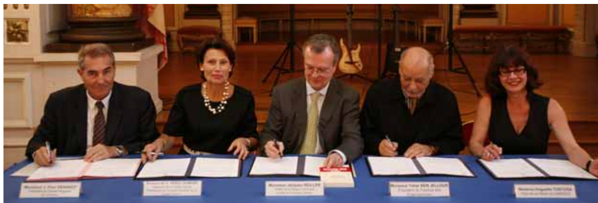
Signature de la convention triennale – mercredi 5 octobre 2011 à la Préfecture de Région