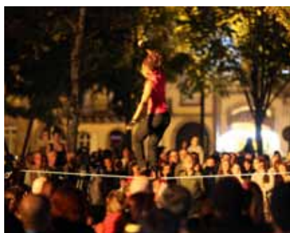
Sur le fil © Patrick Fabre