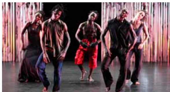
Où vers ?