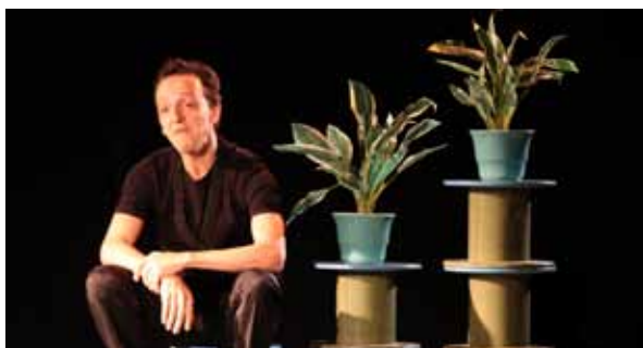
Rue du Croissant