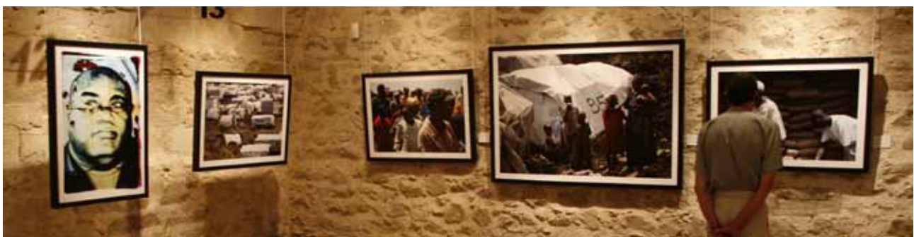
La Porte du non-retour, parcours photographique

Waato Balabala et Institut Français de Kinshasa (R.D. Congo), Festival Transamériques 2011 (Canada-Québec), Institut Français du Congo, le Conseil des Arts du Canada et le Conseil des Arts et des Lettres du Québec, la Délégation générale du Québec à Paris, festival Zones théâtrales (Canada-Ontario). Ambassade de France à Kaboul, Centres culturels français (Niamey, Brazzaville, Kinshasa), Institut français de coopération de Tunis.