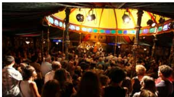
Un concert au Magic Mirrors