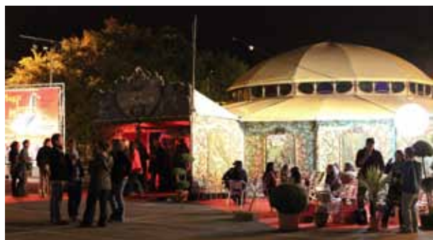
Le Magic Mirrors

La formule du concert à 19h est donc à reconduire, en l'améliorant pour faire vivre ce lieu en après concert.