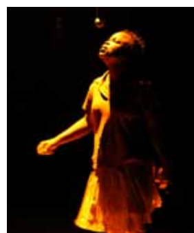
Les Larmes du ciel d'août