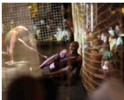
Carré Piste

Cet événement a donné une très forte dynamique au festival 2011 et a réuni un très nombreux public lors de la soirée d'ouverture en plein air sur le Champ de juillet (environ 2.200 personnes).