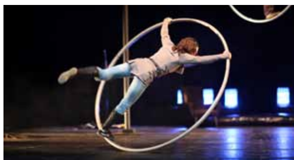
De l'autre côté

› La BFM de Limoges a proposé un cycle de projections Images d'Outremer , avec Soumaïla Koly, auteur en résidence à la Maison des auteurs en 2011.