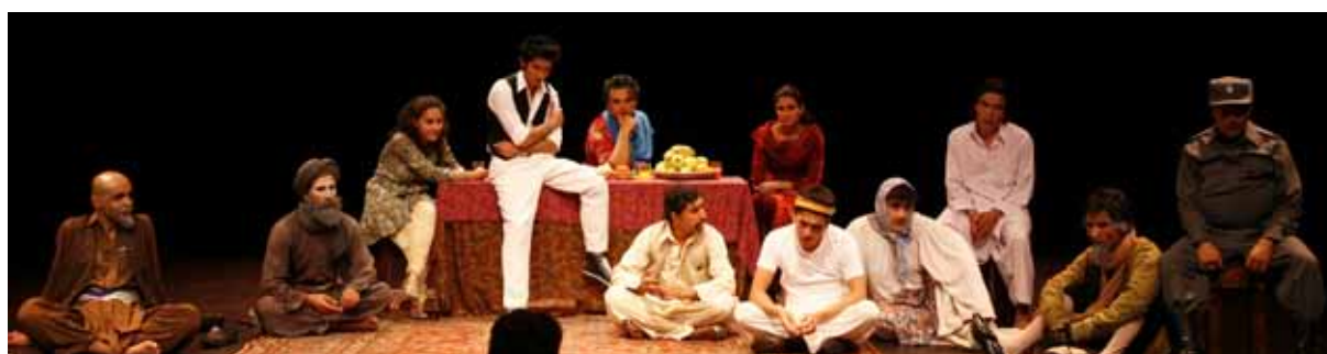
Les comédiens du Théâtre AFTAAB