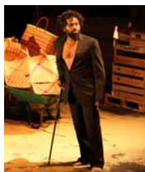
Moroni Blues