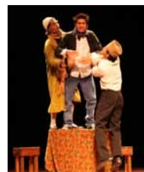
L'Avare © Patrick Fabre