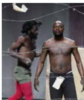
Le Socle des Vertiges © Patrick Fabre