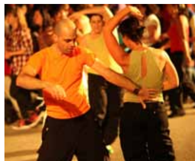
Souvenir de la rue Princesse (soir)