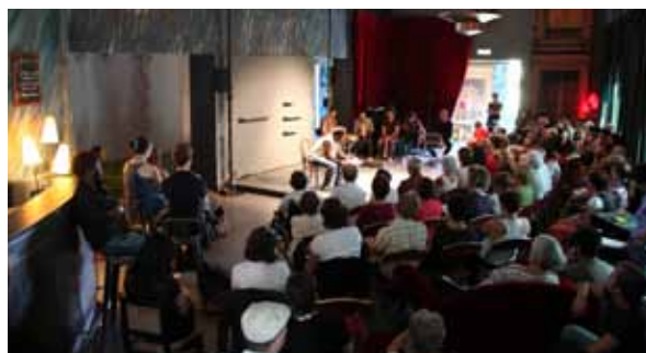
Lecture Terre Rouge