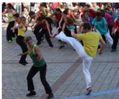
Souvenir de la rue Princesse (après-midi)